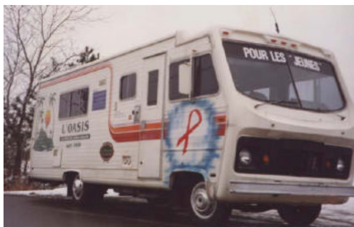
De août 1996 à mai 1998

Au cours de la présente année, une défectuosité mécanique majeure nous a forcés à mettre au rancart notre