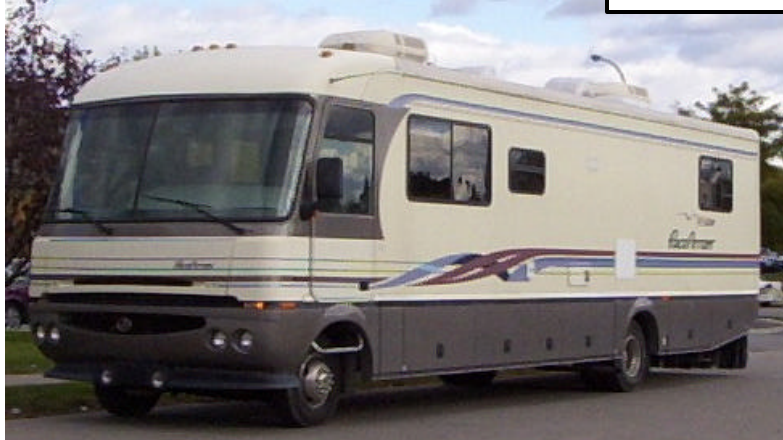
De octobre 2003 à aujourd'hui