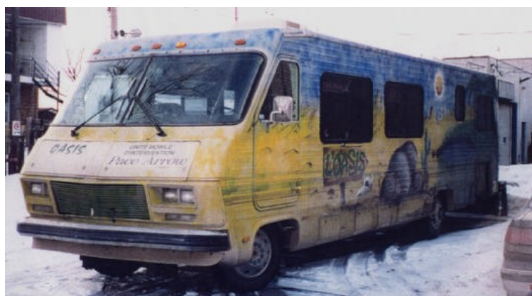
De mai 1998 à août 2002

bonne vieille caravane aux peintures oasiennes qui nous avait été fidèle pendant plus de quatre ans. Il nous a alors fallu travailler d'arrache-pied pour dénicher les fonds nécessaires à l'achat d'un nouveau motorisé. Finalement, c'est une subvention fédérale (IPAC) qui nous a permis de faire l'acquisition de