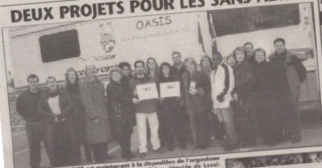
UN NOUVEAU MOTORISÉ est maintenant à la disposition de l'organisme l'Oasis. Sur la photo on aperçoit: Raymonde Felco, députée de Laval-Ouest; Carole-Marie Allard, députée de Laval-Est et la représentante de Madeline Daphond Guival, députée de Laval-Centre, Margot Allard.

Pour venir en aide aux sans-abris de Laval, deux projets ont récemment reçu une aide financière de 501 285 $ du gouvernement fédéral.